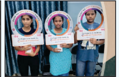
वैक्सीन का मुफ्त टीका लगवाने के बाद फोटो