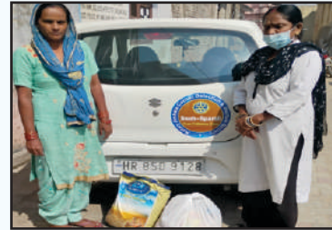
कैंसर से अनाथ हुए परिवार के लिये मुफ्त राशन