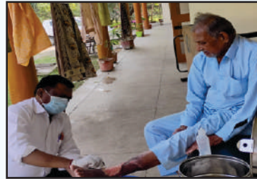
कैंसर मरीजों की उनके घरों में मुफ्त देखभाल